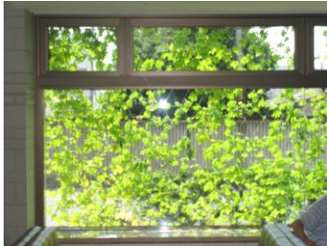
院内から見た緑のカーテン