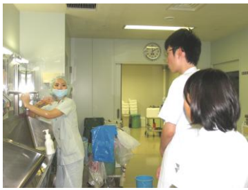
看護師体験（手術室）

8月に、市内の中学・高校から20名の生徒さんが参加し、医師や看護師の職業体験を行いました。医師体験では総合診療科で職員を患者に見立て、聴診器を使った診察体験や救急室、手術室、病棟で回診の見学、手洗い実習などを行いました。看護師体験では診療の補助や入院患者さんの清拭、トイレの案内など、実際に患者さんと接しました。