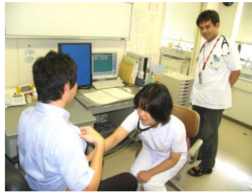
医師体験（総合診療科）

また、リハビリ課や検査課、放射線課の職員から仕事の話を聞き、実際に行っている様子を見学しました。