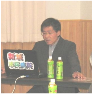
夏目診療運営部長